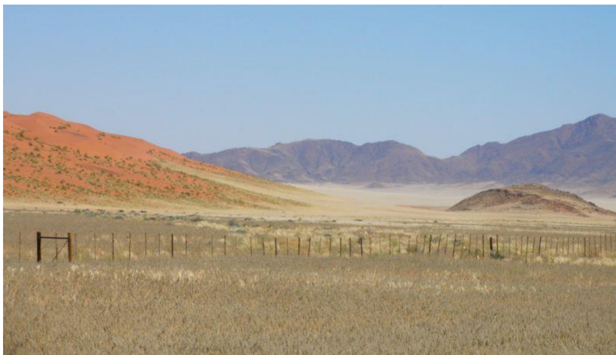
Abb. 4: Wüste Namib (2006).