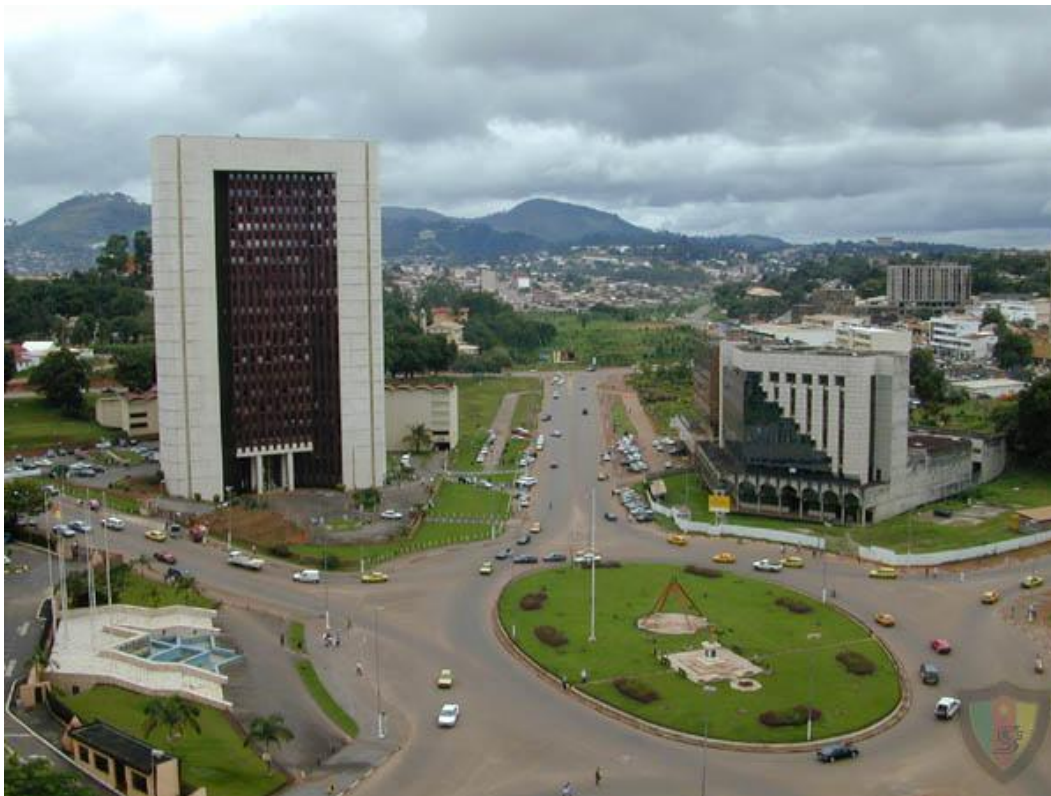
Abb. 2: Zentraler Platz in Yaounde.