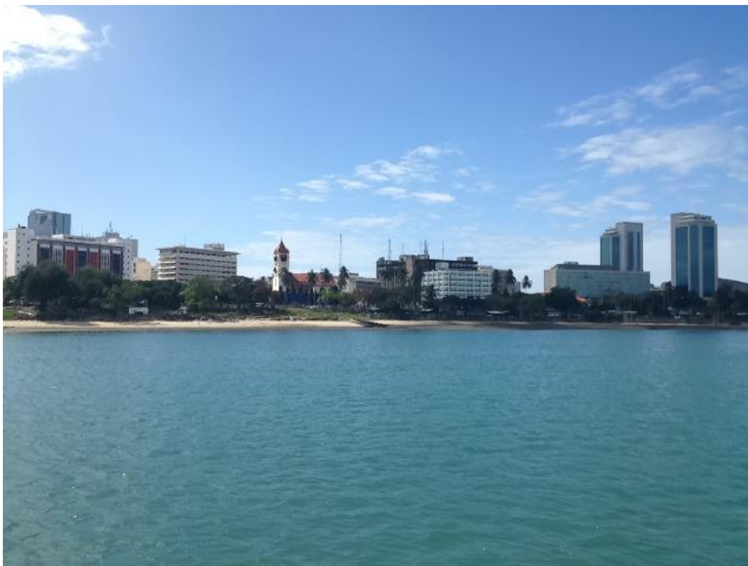
Abb. 3: Skyline von Dar es Salaam (2012).