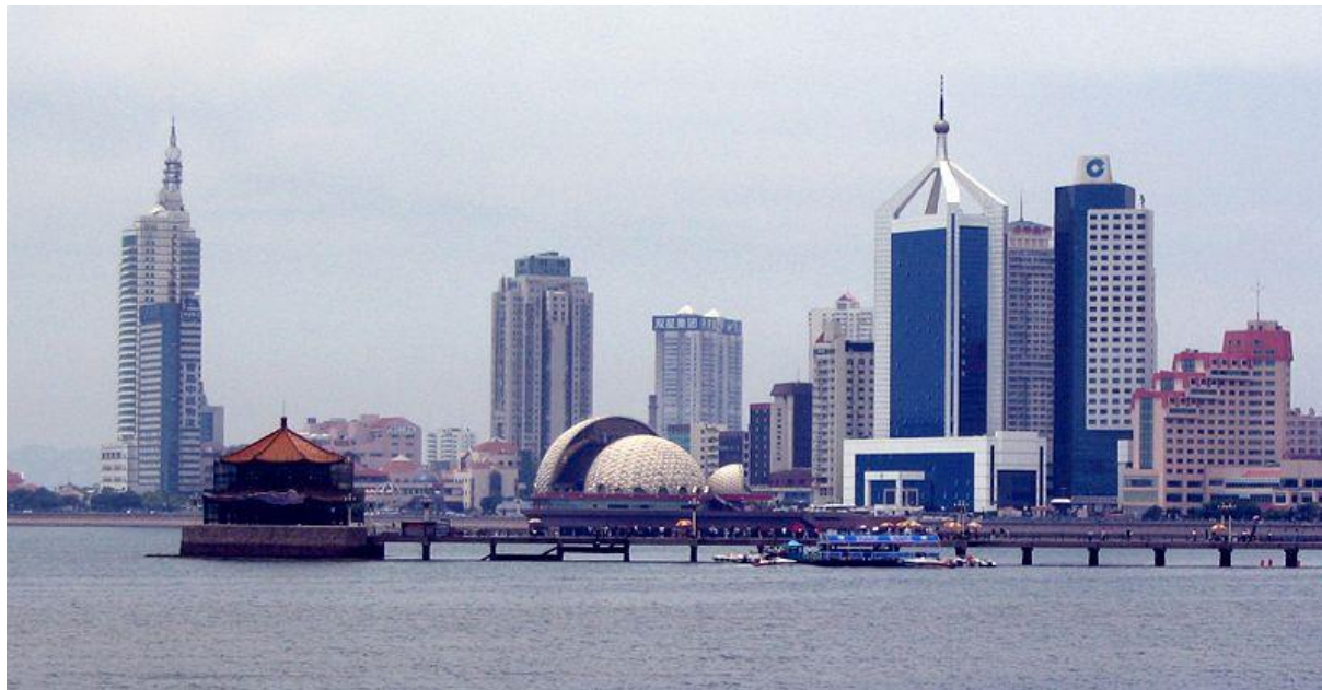
Abb. 5: Hafen von Tsingtau oder Qingdao (2007).